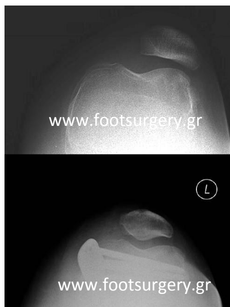
Αρθροπλαστική επιγονατιδομηριαίας άρθρωσης

Περιφερική οστεοτομία μηριαίου (με συνοδό αποκατάσταση του έσω επιγονατιδομηριαίου συνδέσμου) για αποκατάσταση της βλαισότητας του γόνατος και του υπεξαρθρήματος της επιγονατίδας.