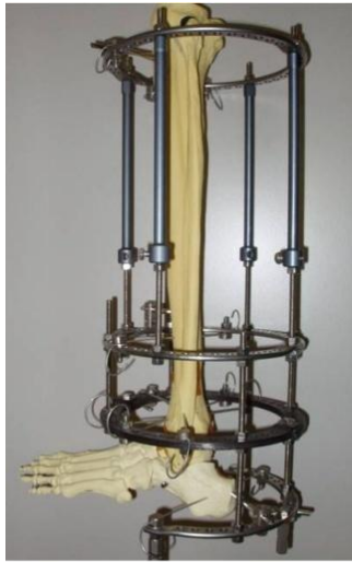
ΕΞΩΤΕΡΙΚΗ ΟΣΤΕΟΣΥΝΘΕΣΗ ΚΥΚΛΙΚΟ ΠΛΑΙΣΙΟ - ΙΛΙΖΑΡΟΒ

Είναι μια μορφή εξωτερικής οστεοσύνθεσης με κυκλικά πλαίσια (δακτυλίους). Οφείλει το όνομά της στον Ρώσο Ορθοπαιδικό Ilizarov που εφάρμοσε τη μέθοδο αυτή από τη δεκαετία του '60.